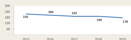
Movimiento de carga vía aérea del Callao Enero - Diciembre (Miles de TM)