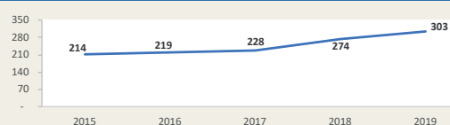
PAITA - Evolución de movimiento portuario Enero - Diciembre (Miles de TEUS)