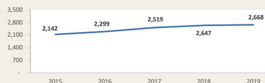
Evolución de movimiento portuario Enero - Diciembre (Miles de TEUS)