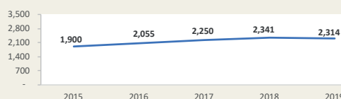
CALLAO - Evolución de movimiento portuario Enero - Diciembre (Miles de TEUS)