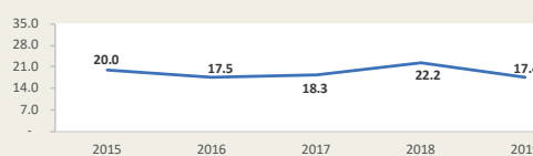
MATARANI - Evolución de movimiento portuario Enero - Diciembre (Miles de TEUS)